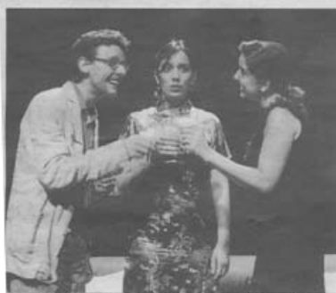
La companyia L'Evocador representà la obra de Muriel Resnik.